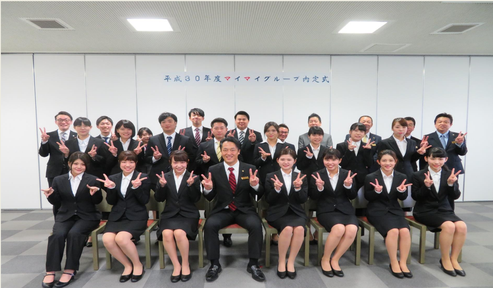
平成30年度マイマイグループ内定式